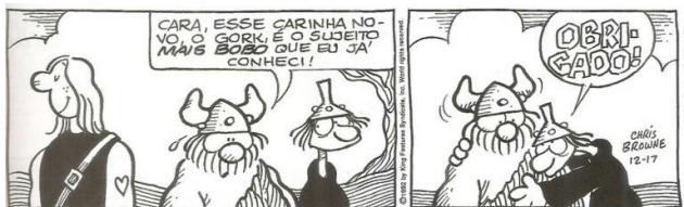
Hagar, de Chris Browne. Folha de S. Paulo, São Paulo, 15 out. 1993.

01 - Leia este diálogo entre Hagar e seu amigo Eddie Sortudo e identifique a afirmação incorreta :