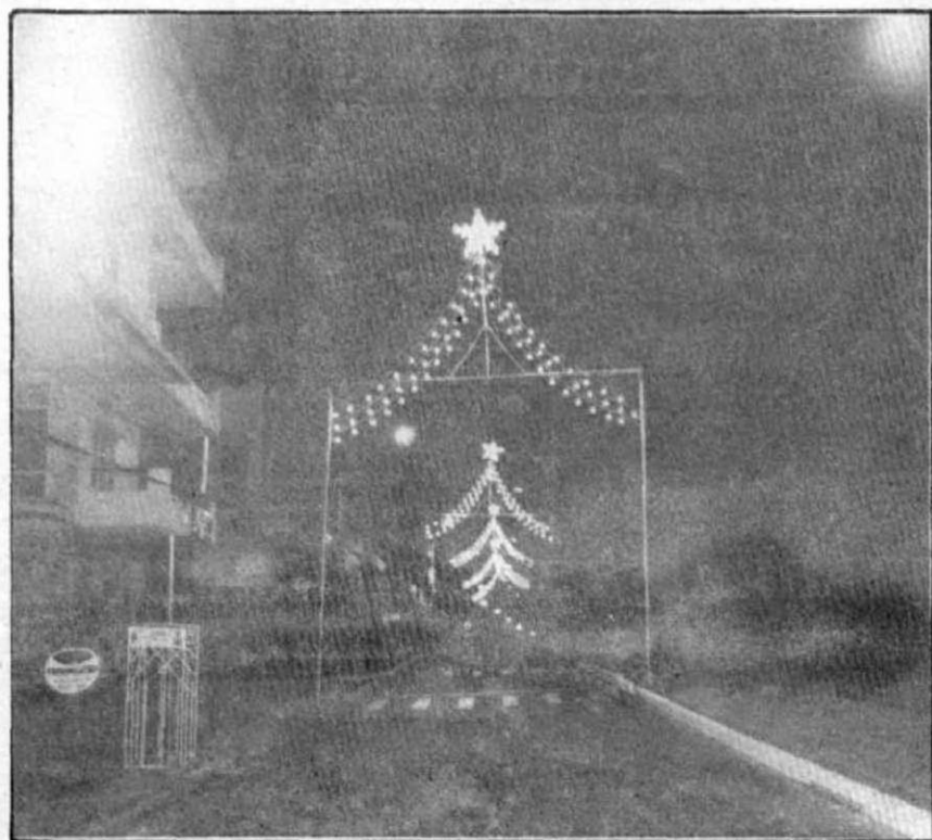
À noite a decoração proporciona um belo efeito visual

Desde o último dia 3 o centro da cidade está ornamentado para o Natal. Milhares de lâmpadas iluminam o principal trecho de Barbacena, englobando a Rua XV de Novembro, Praça dos Andradas e Rua Tiradentes, além das árvores do Jardim do Globo e das imediações da Matriz da Piedade.