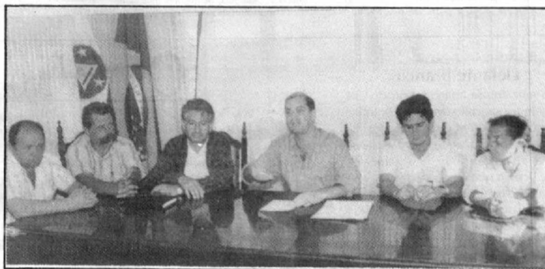
O Prefeito Toninho Andrada, ladeado pelos vereadores Pedro do Vale, José Luiz de Sena, Jair Barraca e Geraldo Milagres e pelo Vice-prefeito Paulo Scarpelli, anuncia "pacote" de medidas em favor do funcionalismo municipal.

Servidores efetivos terão mais 5% de aumento em julho e magistério terá aumento variável de 56% a 135%