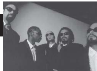
sábado - 15/10 O RAPPA