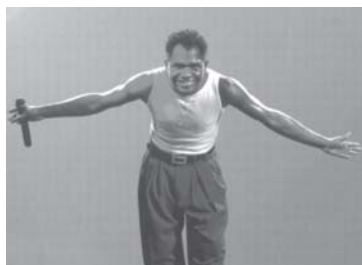
quinta - 13/10 ARAKETU