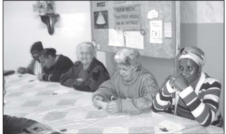
Várias atividades fizeram parte das comemorações do Dia do Idoso