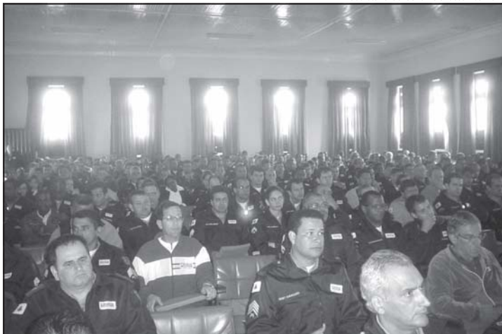
Policiais militares durante seminário na Escola Agrotécnica Federal de Barbacena