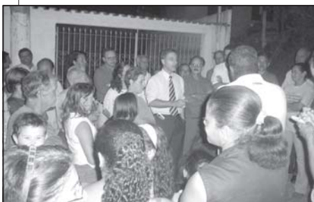
O prefeito Martim Andrada na entrega do calçamento da Rua Luciano Pupo Nogueira

O prefeito Martim Andrada disse que aquela era a primeira rua que estava sendo entregue calçada e que existem outras que estão sendo arrumadas em diversos locais da cidade.