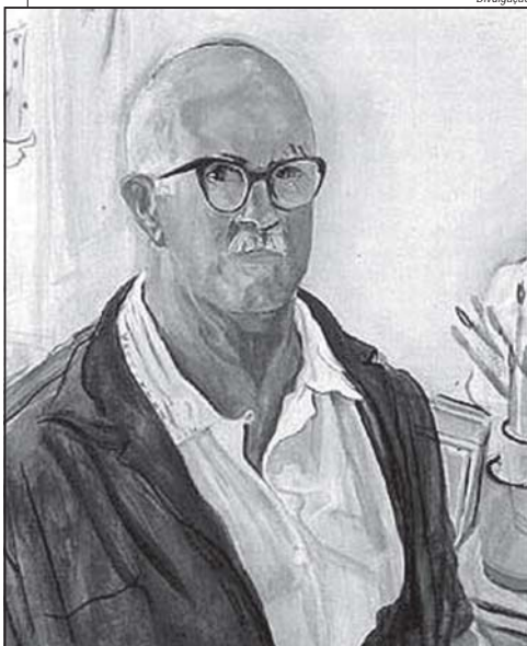
A esquerda, obra do artista Guignard e abaixo escultura de Aleijadinho