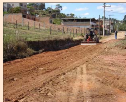
Patrolamento da Av. Olinda de Mora Cruz