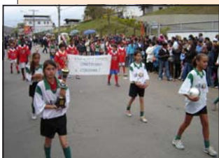
Encerramento do desfile pelo Instituto Padre Cunha