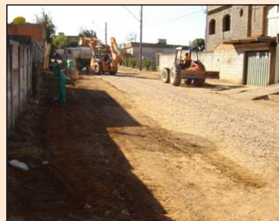
Retirada de entulho na rua Arisitides Garcia de Paiva