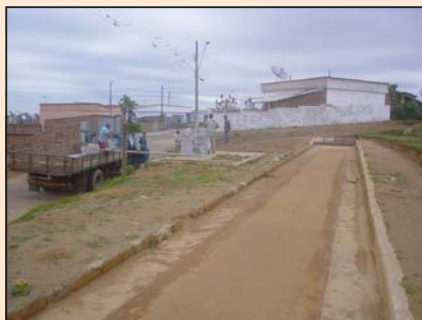
Reforma do campo de malha localizado na rua Sargento Orlando Passos