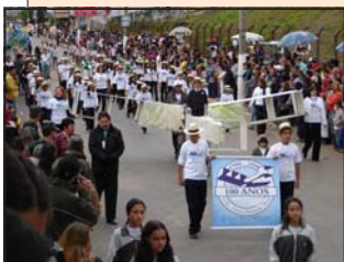
Homenagem a Santos Dumont realizada pelo Colégio Tiradentes

Em um só pelotão, composto por 800 estudantes, as escolas da rede municipal encantaram o grande público presente, apresentando os vários projetos que são desenvolvidos com seus alunos. O Instituto Padre Cunha encerrou o desfile apresentando o que é realizado pela instituição.