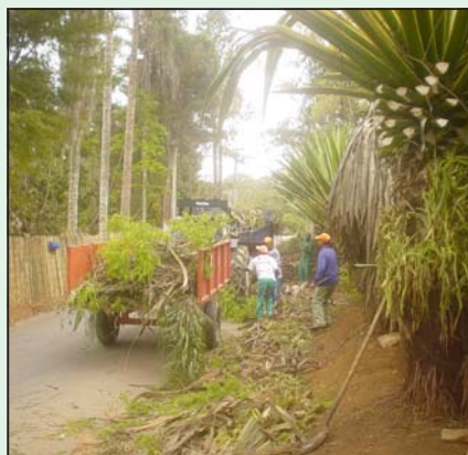
Limpeza da rua Luiz Delbem, no bairro Roman

Quem passou pela Sala Verde "Loucos pelo Meio Ambiente" na última semana foram alunos da 4ª série da Escola Municipal Embaixador Martim Francisco, do Caic. Eles também foram em busca de informações sobre recursos hídricos. Participaram de palestra, oficina de artes e de uma atividade recreativa no computador.