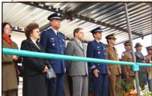
Autoridades durante o desfile