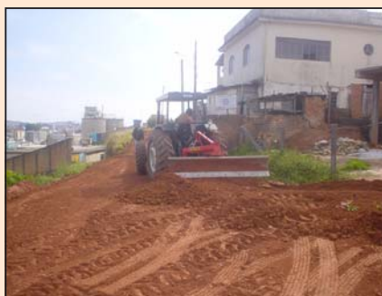
Patrolamento da rua João Guilhermino de Assis