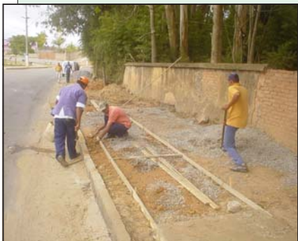
Construção de calçada na rua José Felipe Sad, no bairro do Carmo