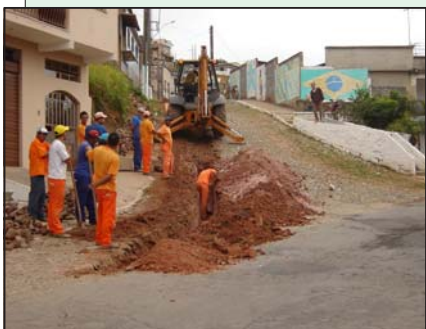
Recuperação da rede de esgoto da rua Luiz Gava, no bairro Passarinhos.