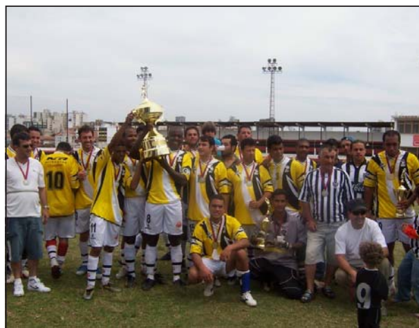
Com uma boa campanha e de forma invicta, a Rivelli conquistou o troféu da 3ª Copa do Trabalhador

Já pelo Campeonato Varzeano Interbairros 2006, no último domingo foram disputadas as primeiras partidas da fase semifinal. O Minas A venceu o CFC por 2 x 1 e precisa apenas de um empate no segundo jogo para chegar às finais. Já Ypiranga e Mosqueteiros ficaram no empate em 1 x 1. Os jogos de volta acontecem nesta sexta, dia 15, no estádio Santa Tereza, a partir das 9 horas. A final será disputada no domingo, dia 17, no estádio São Sebastião.