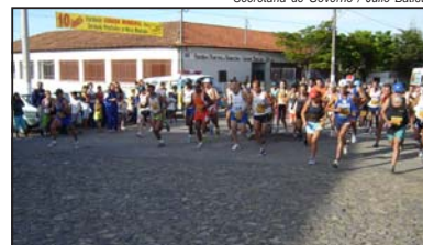
Momento da largada