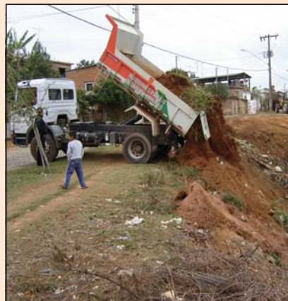
Trabalho de aterro