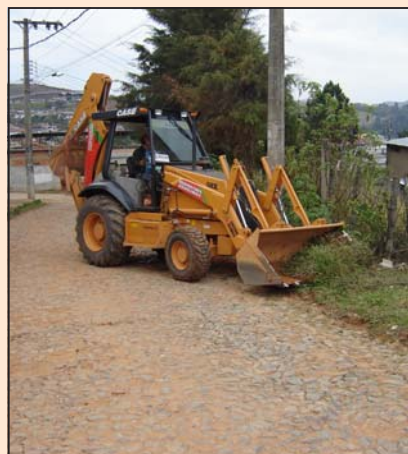
Retirada de entulhos