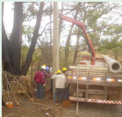
Iluminação entre a Sericicula e a Vila do Sargento