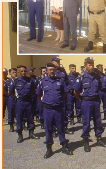
Pelotão da Guarda Municipal