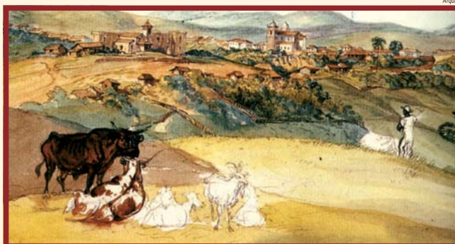
Rugendas, Johan Moritz (1802-1858), pintor alemão de cenas brasileiras,

Entre as notas do livro de José Pedro Xavier da Veiga estão um crime e a elevação de Barbacena de vila à cidade