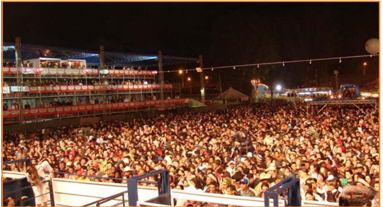
Secretaria de Governo / Julio Batista

Mais de 70 mil pessoas participaram da 40ª Exposição Agropecuária de Barbacena, que foi considerada um grande sucesso, tanto no aspecto turístico, quanto no aspecto comercial. A estimativa é de que mais de R$ 5 milhões tenham sido movimentados durante a Exposição, seja diretamente nos leilões de cavalos e gado realizados no Parque de Exposições, quanto pelos setores de serviços, alimentação e hotelaria, que se beneficiaram pelo grande número de turistas presentes na cidade. PÁGINAS 6 e 7