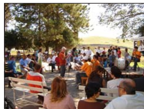
Secretaria de Governo / César Calmeiro

No mesmo dia foi aberta a exposição em comemoração ao Dia Nacional da Luta Antimanicomial, nas dependências do Museu da Loucura. A Semana dos Museus movimentou a área artística, com exposição e também várias escolas com diversas apresentações e atividades recreativas que levaram vários alunos ao Parque do Museu Casa de Marcier (foto).