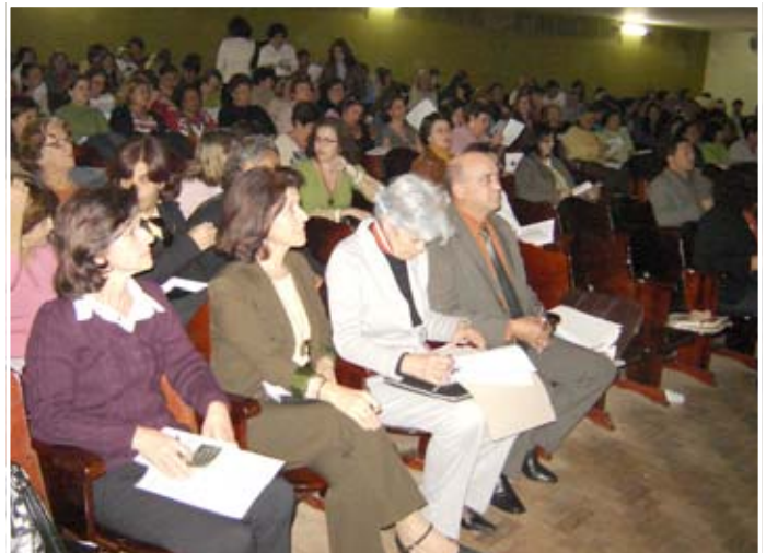
Uma cartilha foi entregue para as escolas com os resultados da pesquisa que foi realizada de 2000 a 2006.