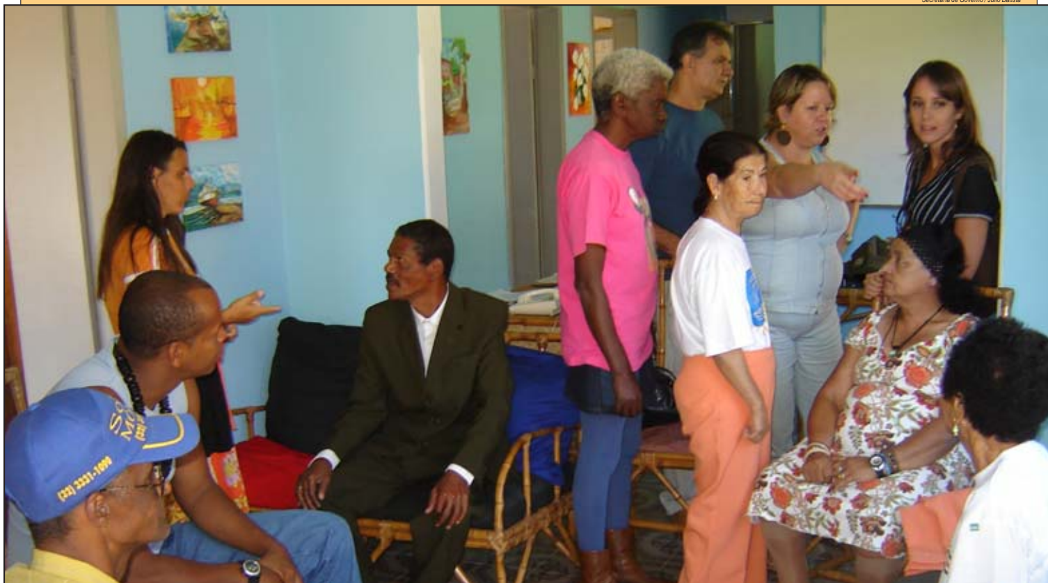
Programa abordando tratamento na área de saúde mental e as residências terapêuticas deverá ser exibido no segundo semestre

Reconhecida nacionalmente por ser referência no tratamento de pacientes portadores de sofrimento mental, Barbacena voltou a atrair a atenção da mídia. Na última semana, uma equipe do Canal Saúde esteve na cidade preparando um documentário com o tema "Saúde Mental", que será exibido provavelmente no início de agosto. Segundo o produtor do programa, Cristovão Paiva, a cidade foi escolhida pela história que possui e pelo fato de estar sempre à frente nesta questão. "Não podíamos ter escolhido lugar melhor", disse.