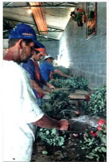
BENEFICIAMENTO DAS rosas: flores já saem embaladas

— Minha arrancadê se deu após os cursos, e hoje, a produção cresce cerca de 100% ao ano — conta.