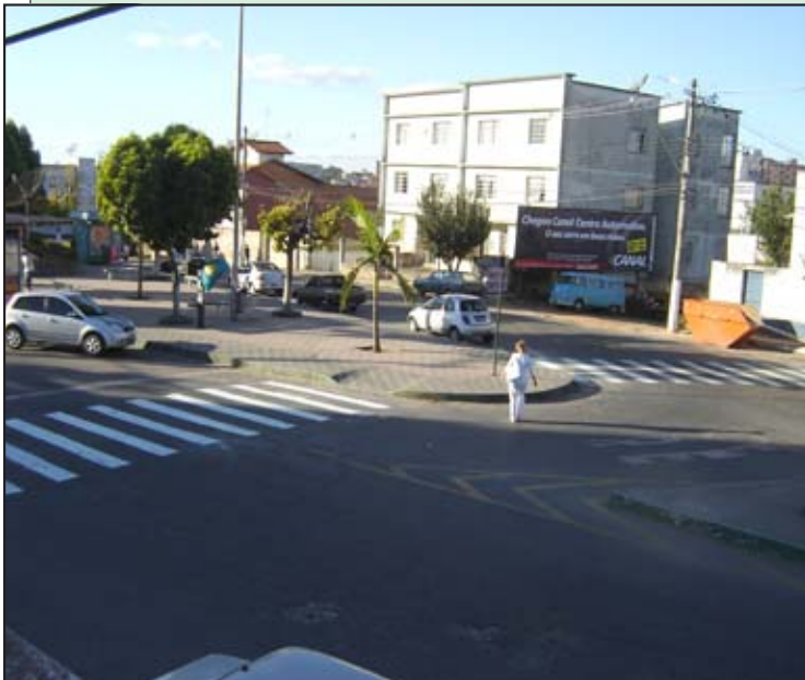
A faixa de pedestres em frente à Escola Estadual Bias Fortes, no bairro Boa Morte, foi repintada na semana passada

Durante todo o mês de julho, o Governo Municipal, através da Superintendência de Trânsito e Transportes (Sutrans), estará dando continuidade ao Projeto Escola, iniciado no ano passado, com a implantação de placas de advertência de área escolar e redução de velocidade em 30 Km/h. Os trabalhos de continuidade do projeto foram iniciados em junho e visam melhorar a condição de segurança em todas as escolas do município e dos distritos. No segundo semestre deste ano letivo, todas as escolas da cidade e aquelas localizadas nos distritos que possuem pavimentação asfáltica, já estarão sendo atendidas pelo projeto.