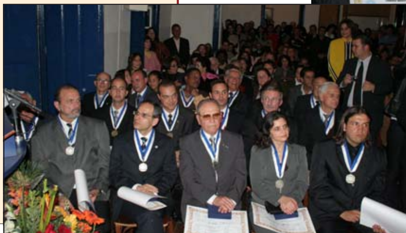
Autoridades e cidadãos foram homenageados na Câmara Municipal