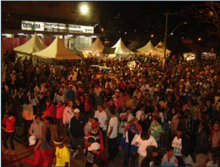
A avenida Governador Bias Fortes voltou a receber grandes públicos, assim como no Carnaval deste ano