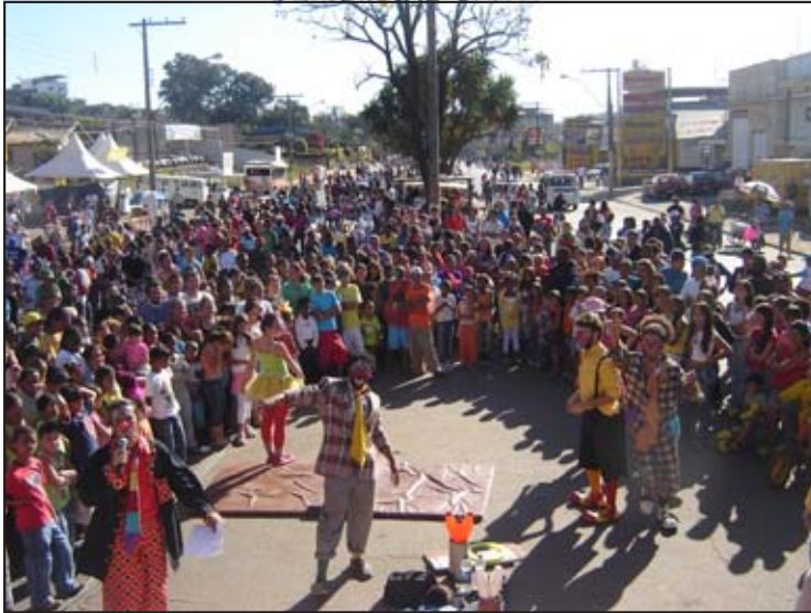
Atrações culturais descontraíram os presentes durante o dia na avenida Governador Bias Fortes