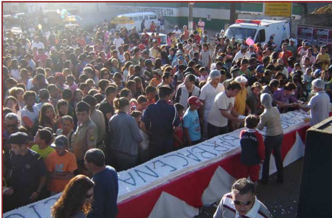
Um bolo de 30 metros e mais de 200 quilos foi distribuído à população no dia 14

Pela primeira vez o aniversário da cidade tem uma ampla programação.