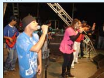
Show da banda Soul, no domingo, dia 12