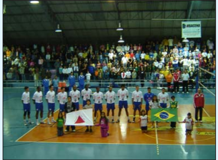
Equipe do Telemig Celular/Minas, campeã da Superliga de Vôlei Masculino: convidados de honra