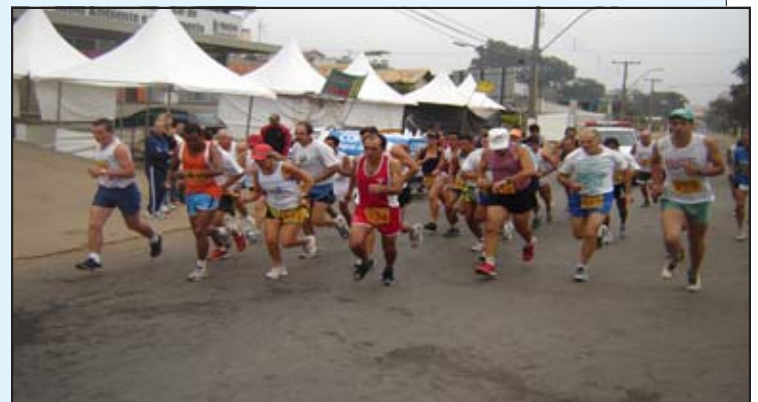
Largada da corrida rústica "Cidade das Rosas": vencedores receberam troféus e rosas