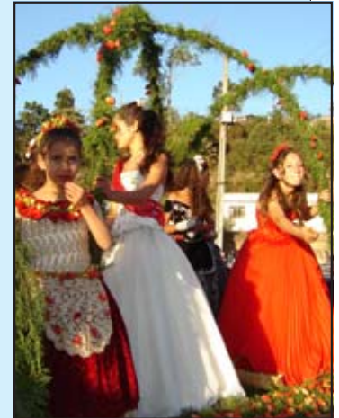
Secretaria de Governo / César Carneiro