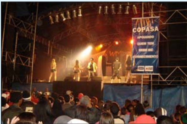
A banda WM50 se apresentou para um grande público na véspera do feriado