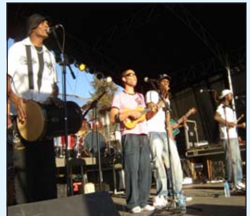
Grupo Traduscy animou a tarde de terça-feira