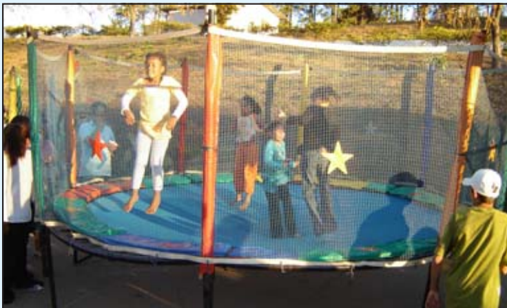
As crianças se divertiram com os brinquedos instalados na avenida Governador Bias Fortes