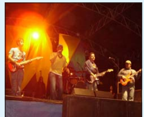
A banda Camaleões abriu a programação, com um animado show