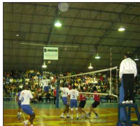
Lance da partida entre a seleção chilena e o Telemig Celular/Minas

Mesmo sem Nalbert, o Telemig Celular/Minas veio a Barbacena com sua equipe titular. Os destaques do time são o meio Jardel, o libero Serginho, o ponta Ezinho e o levantador Rafinha, todos muito saudados pela torcida. Já os chilenos, disputam os amistosos com o mesmo time que terminou os jogos Pan-Americanos do Rio de Janeiro em sexto lugar.