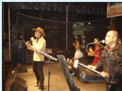
Para quem gosta do estilo country, a atração principal foi o show da Cia. Sertaneja