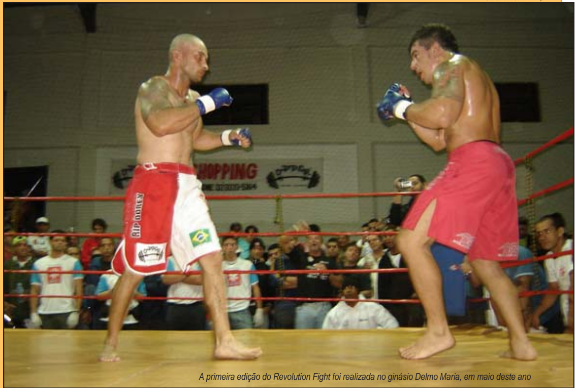
A primeira edição do Revolution Fight foi realizada no ginásio Delmo Maria, em maio deste ano