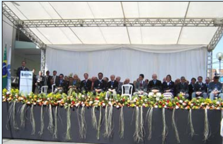
A solenidade reuniu diversas autoridades na praça Conde de Prados