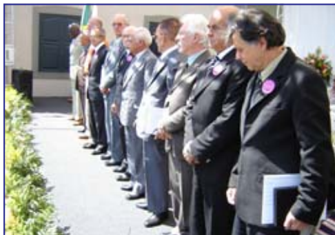
Homenageados receberam a insígnia pelos serviços prestados ao município

Barbacena ganha selos alusivos aos seus 216 anos