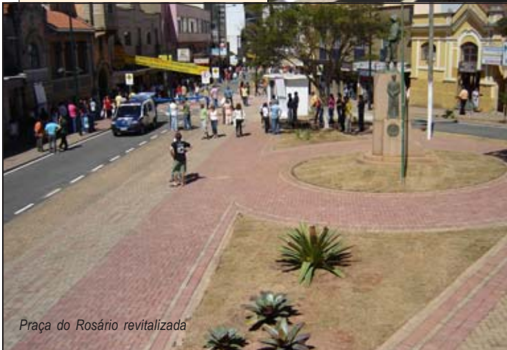
Praça do Rosário revitalizada