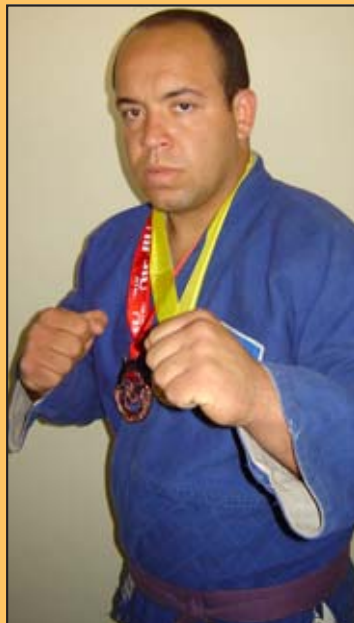
Secretaria de Governo / Jiu Jitsu