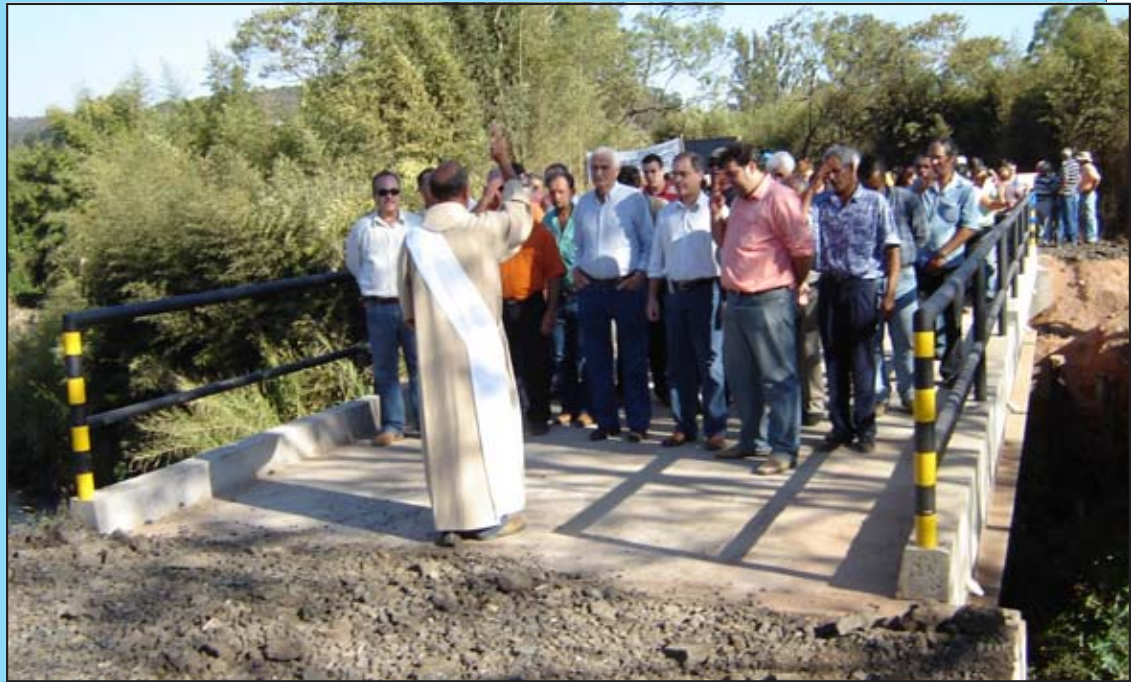
Uma cerimônia religiosa marcou a inauguração da nova ponte

A ponte que era utilizada pelos moradores foi destruída pelas fortes chuvas que caíram sobre a cidade no início deste ano. O Governo Municipal, imediatamente, construiu uma provisória, em parceria com as comunidades, para que os moradores não ficassem isolados. (Márcio Cleber)