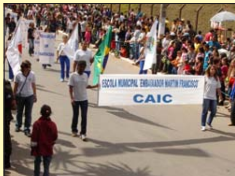
A E.M. Embaixador Martim Francisco apresentou o sistema educacional existente na cidade