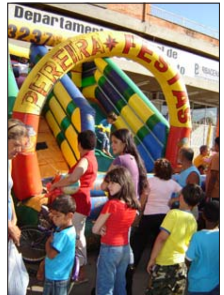
Os brinquedos infláveis montados na avenida atraíram as crianças

Teatro e muitas brincadeiras animaram as crianças, que não economizaram energia para participar. As bandas Tradusy e Soul subiram ao palco e fizeram a festa com as pessoas, que cantaram e dançaram até às 23 horas. Mais uma vez, o Governo Municipal surpreendeu a população com mais um evento que teve como principal finalidade proporcionar divertimento para as pessoas. A avenida mais uma vez foi toda ocupada pela população e visitantes.