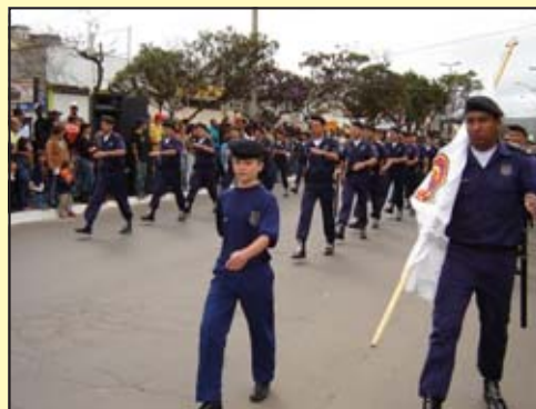
Desfile da Guarda Municipal de Barbacena