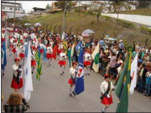
O Colégio Tiradentes apresentou as conquistas esportivas da instituição