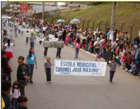
A Escola Municipal Coronel José Máximo retratou os pontos turísticos de Barbacena