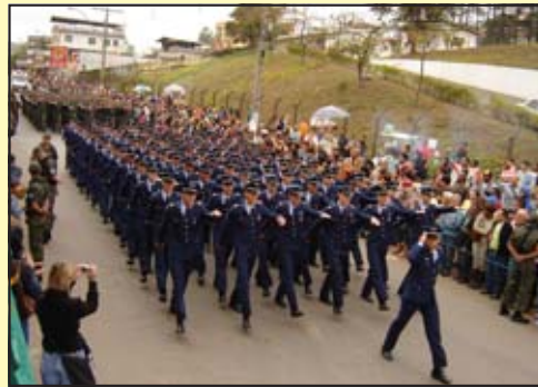
Desfile da Escola Preparatória de Cadetes do Ar