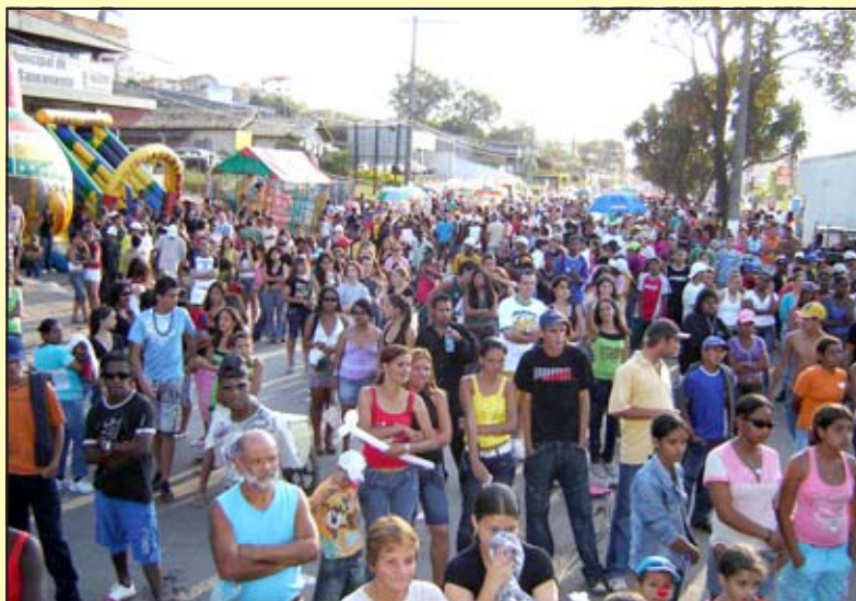
A avenida Governador Bias Fortes recebeu, novamente, um grande público