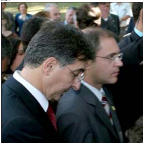
O prefeito Martim Andrada (PSDB) e o prefeito de Belo Horizonte, Fernando Pimentel (PT), defendem a parceria com a Copasa

Criada em 1963, a Copasa está hoje em mais de 600 municípios mineiros, atendendo a mais de 12 milhões de pessoas, sendo que em muitos deles a parceria já dura há mais de 30 anos, sinal de que os serviços prestados atendem aos anseios da população.