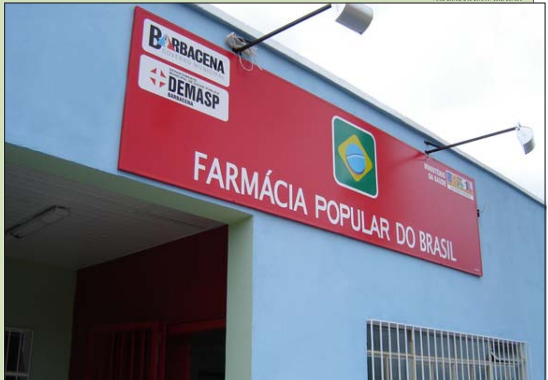
Fachada do prédio onde funcionará a Farmácia Popular

Antes de entrar em funcionamento, os funcionários da farmácia passarão por um curso de capacitação oferecido pela fundação, o que facilitará em um atendimento com mais rapidez e qualidade. A visita