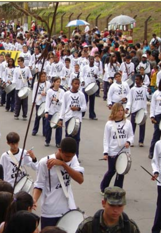
esporte como forma de qualidade de vida"

temas, como esporte, educação, história, geografia e artes