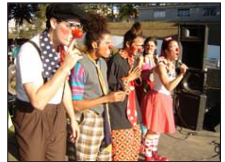
Um grupo de palhaços divertiu o público na parte da tarde

O feriado de 7 de Setembro em Barbacena não foi só de comemoração oficial da Semana da Pátria. Depois do desfile cívico, que aconteceu na parte da manhã, os moradores e visitantes tiveram uma tarde repleta de recreação, que aconteceu também na avenida Governador Bias Fortes.