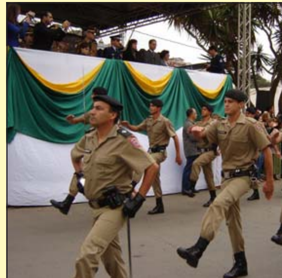
Os Sentinelas da Mantiqueira desfilam observados pelas autoridades civis e militares