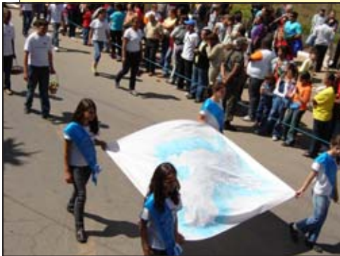
Os distritos que compõem o município de Barbacena foram apresentados pelos alunos da Escola Municipal Benjamim Ferreira Guimarães, de Padre Brito