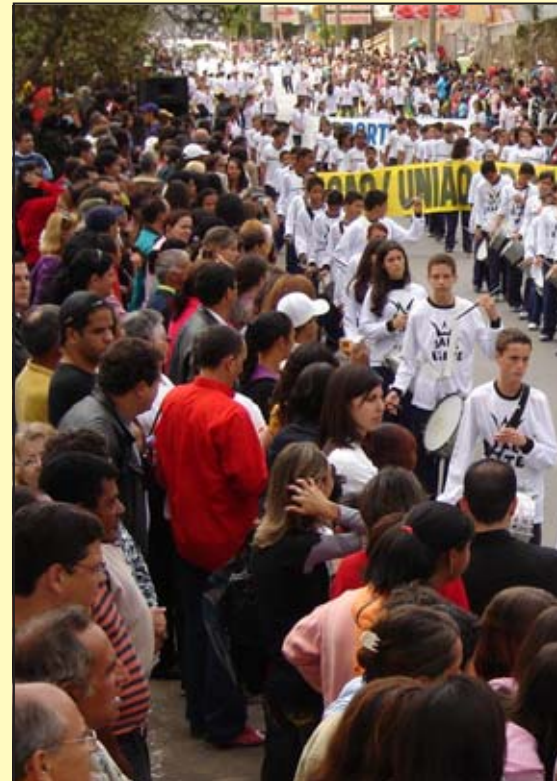
A Escola Municipal Acadêmico Abgar Renault desfilou ao som de sua fanfarra e apresentou o tema "O