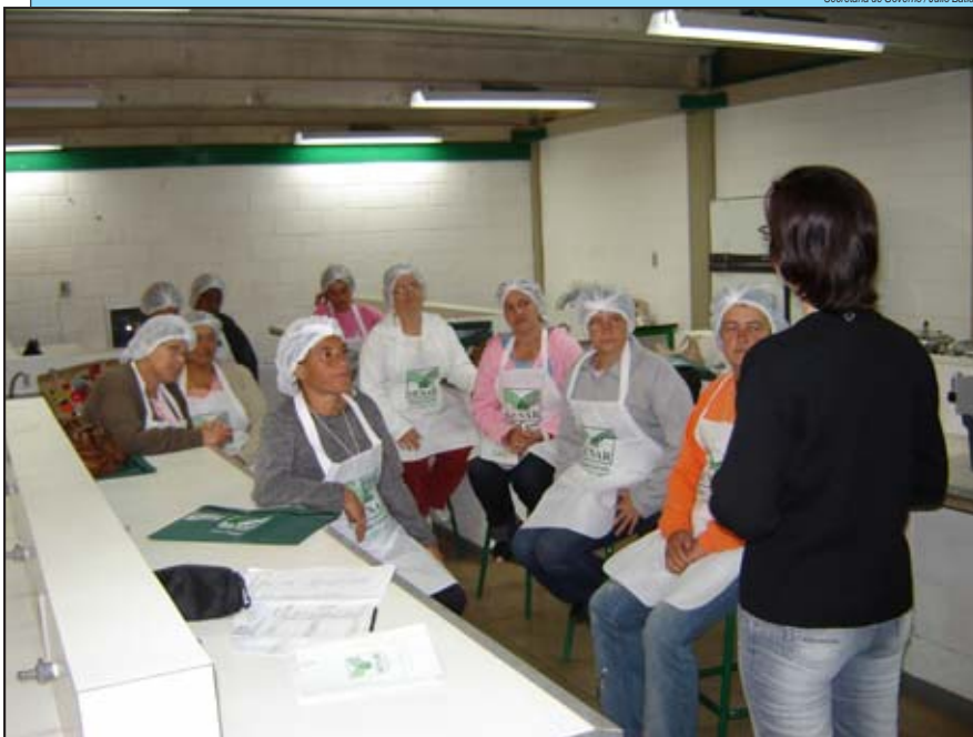
Cantineiras participando do curso de Noções Básicas de Nutrição e Alimentação

Um curso de Noções Básicas de Nutrição e Alimentação promovido pelo Senar/Minas está capacitando as 74 cantineiras das escolas da rede municipal. Elas estão recebendo mais orientações sobre conservação dos alimentos, técnicas corretas de cocção, preparo dos alimentos mantendo o valor nutricional e a importância da higiene pessoal, com os equipamentos, os alimentos e o local de trabalho.