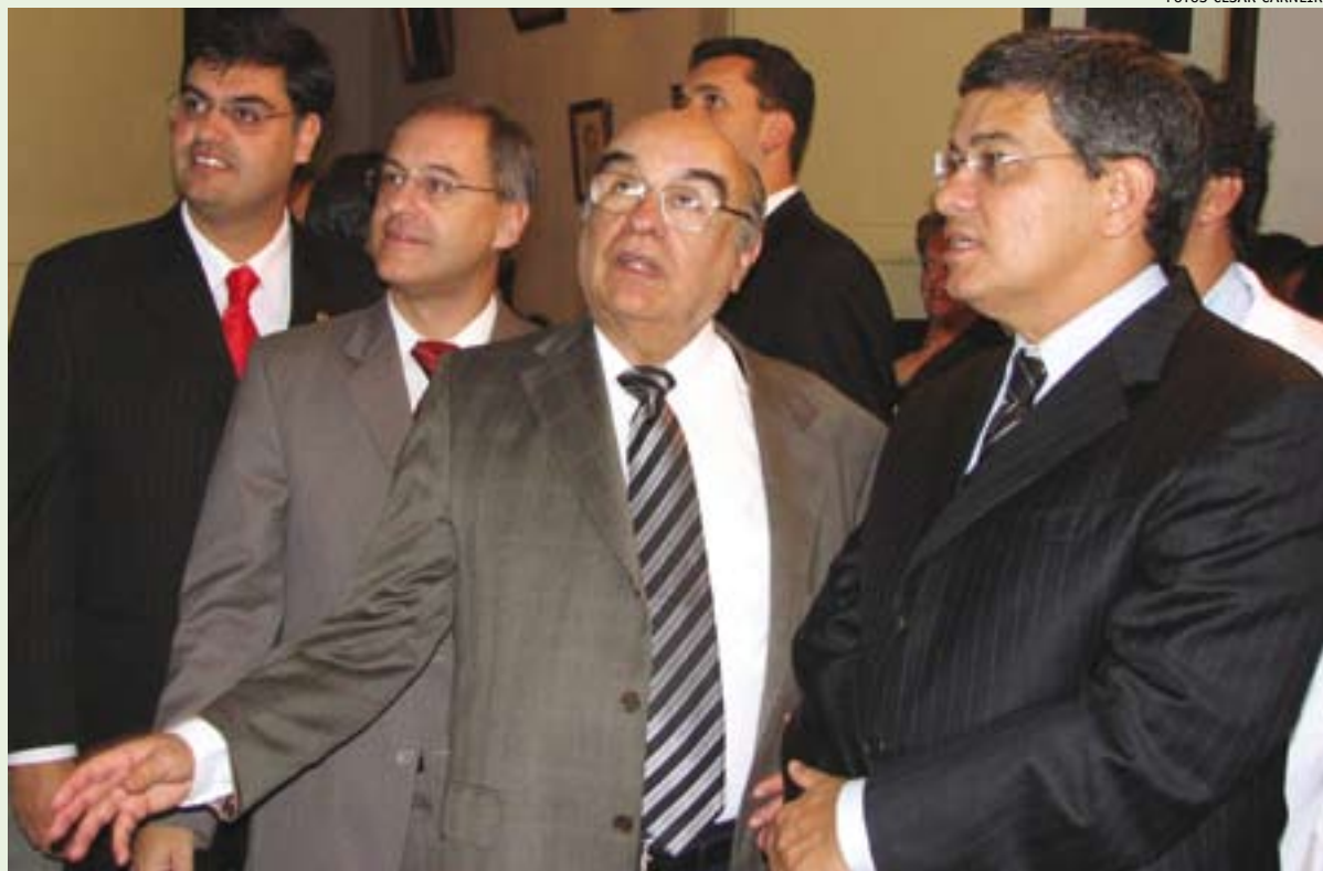
O secretário de Estado da Saúde Marcus Pestana e autoridades visitaram os novos setores reformados e ampliados na Santa Casa de Misericórdia de Barbacena

Outras melhorias, como a construção de um laboratório, da sala de Raio-X e de uma sala de serviços de nutrição já estão previstas. Para isto estima-se um repasse de mais R$ 3 milhões. "A Santa Casa é a maior prestadora de serviços do SUS na Macrorregião de Barbacena. Os investimentos que