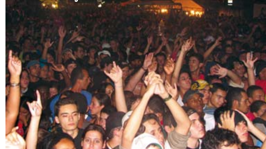
Show da cantora Pitty atraiu 14 mil pessoas no segundo dia da festa

O Festival da Loucura mais uma vez cumpriu a missão de abrir espaço para as mais diversas manifestações culturais e artísticas, incluindo em sua programação shows, exposições e apresentações teatrais. A organização também se preocupou em garantir o conforto dos participantes e montou uma tenda com uma arquibancada para 400 pessoas, onde aconteceu grande parte dos eventos do Festival. Em todas as apresentações a tenda ficou lotada.