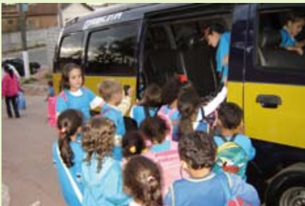
O Governo Municipal ampliou o transporte escolar