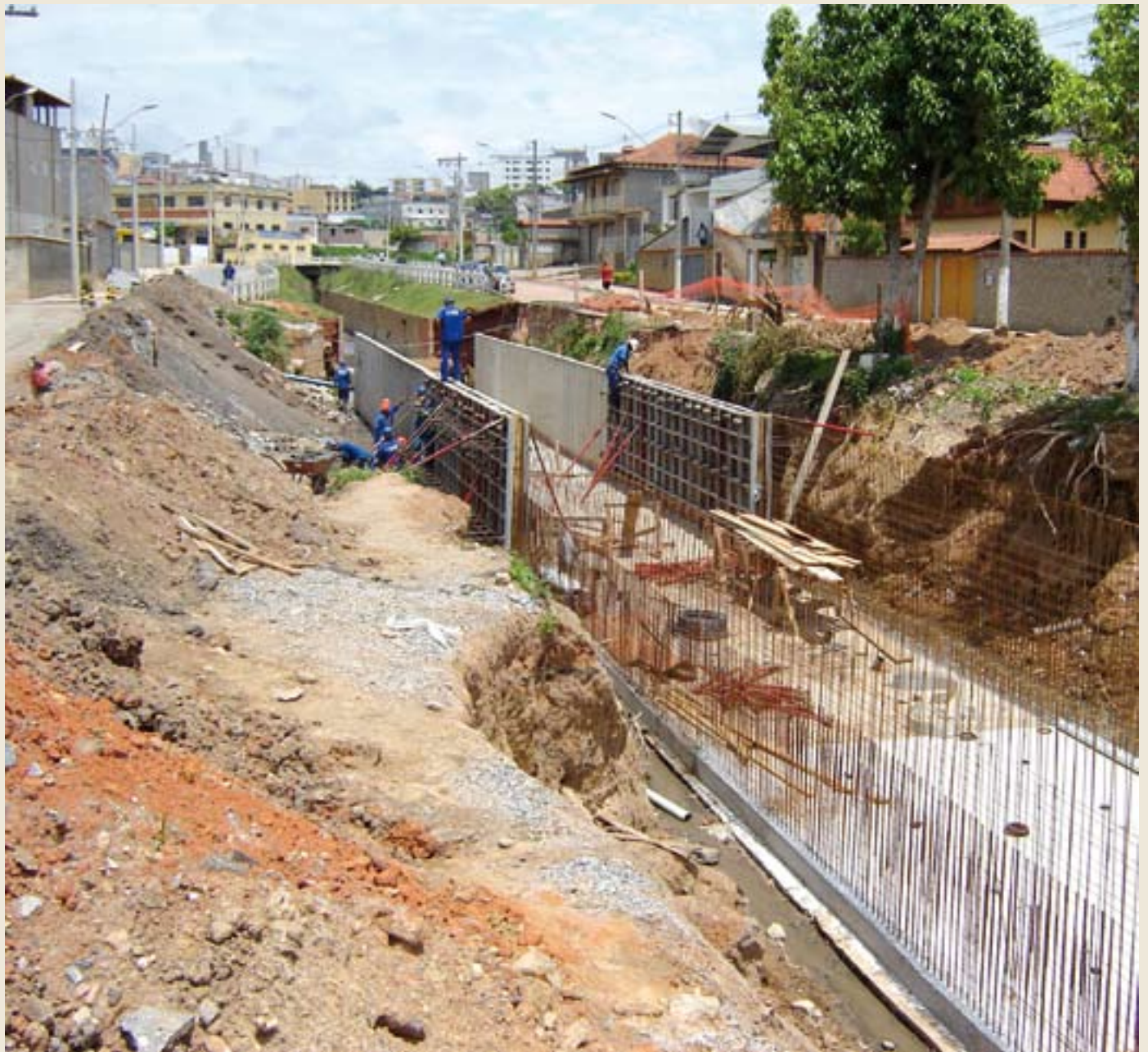
O segundo trecho da avenida sanitária, no bairro Funcionários, está sendo construído em parceria com o Estado