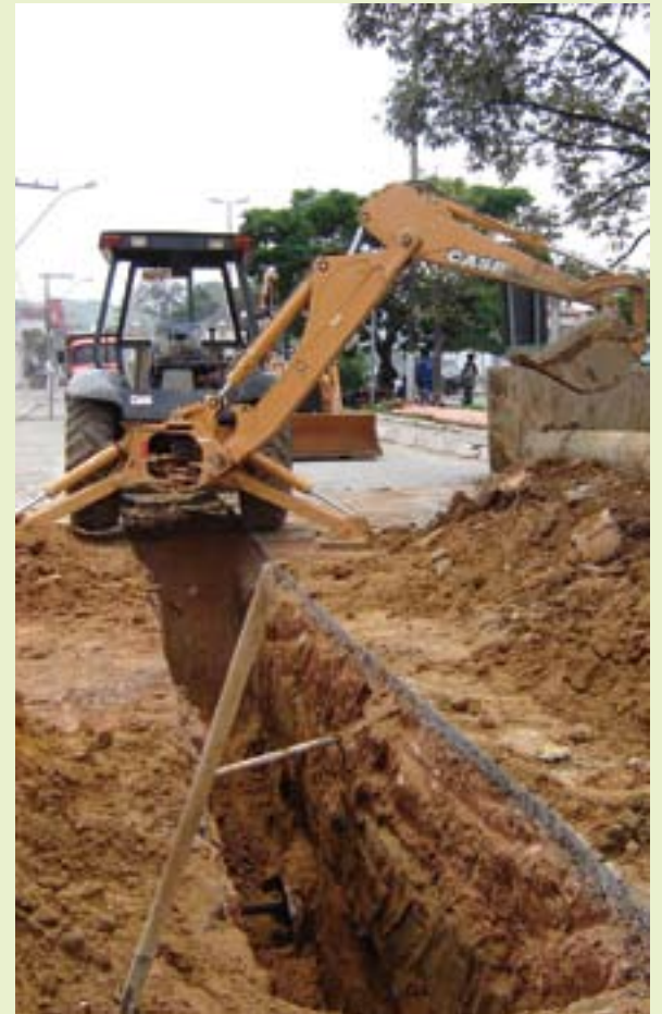
Obra de saneamento feita pela Copasa no Pontilhão