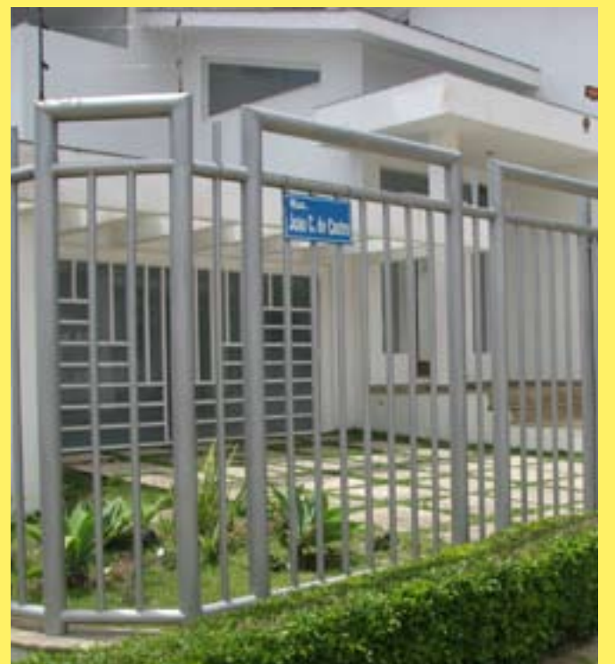
Rua João Calmeto de Castro, no bairro Belvedere

Além destas ruas, já nominadas, outras, cuja nomeação é recente, também receberão placas em breve, como a Avenida Prefeito Vicente Araújo (primeiro trecho da avenida sanitária), as Ruas Manoel Nestor Tinoca e Josemaria Escrivã (ambas próximas à Pedreira), José Rodrigues de Oliveira (na rodovia Ponto Chic/Padre Brito), a praça Urias Barbosa (próxima ao Hospital Ibiapaba) e a rua Altair Savassi (Monte Mário). (SM)