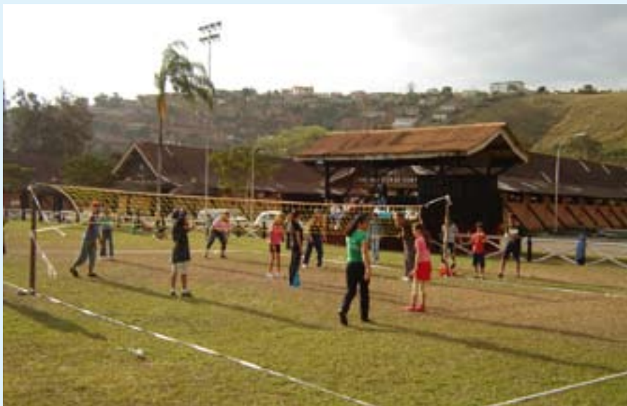
Usuários do Crapca durante colônia de férias realizada em 2007

Além destes centros de referência, o Governo Municipal implantou ainda importantes programas de ressocialização na cidade, como o Proteja (antigo Sentinela), que trata de crianças vítimas de abuso sexual e o Pró-Jovem Adolescente, cujo objetivo é oferecer aos jovens cursos profissionalizantes e ampliar as suas chances no mercado de trabalho.