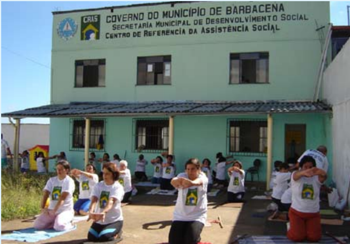
O Cras São Pedro oferece, dentre outras atividades, ginástica para a terceira idade