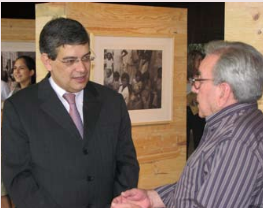
O secretário de Estado de Saúde, Marcus Pestana, esteve presente na solenidade de lançamento do livro

O livro será lançado também em Barbacena, possivelmente no início de 2009, ano em que se comemora os 30 anos da Reforma Psiquiátrica, cujo marco foi o III Congresso Mineiro de Psiquiatria, realizado em 1979.