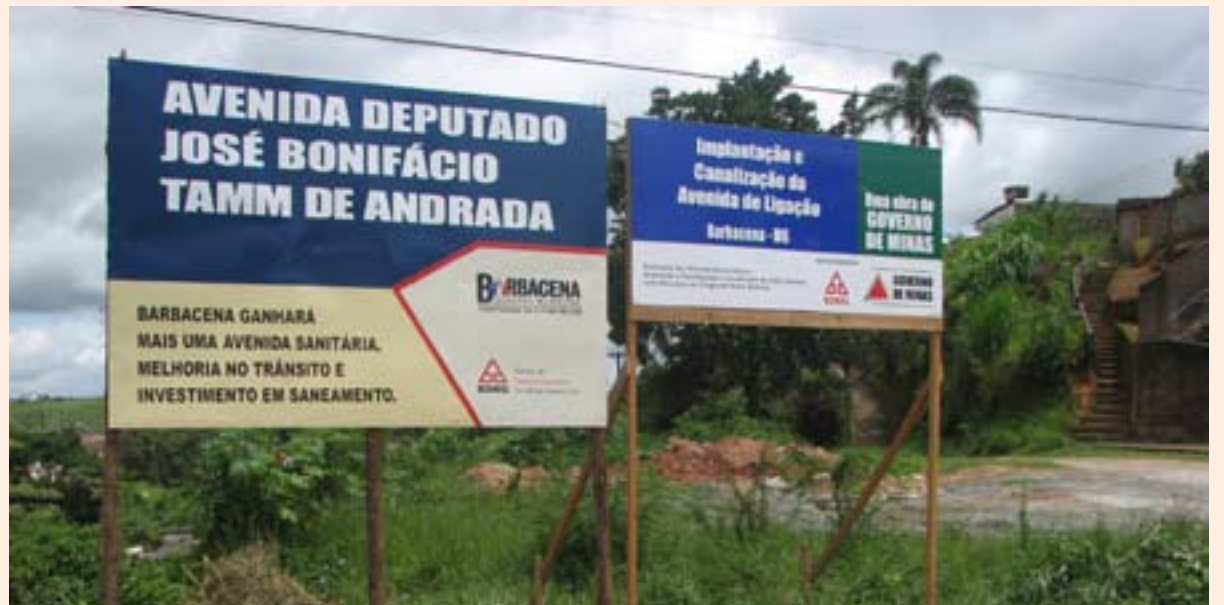
O terceiro trecho da avenida sanitária teve suas obras iniciadas nos últimos dias