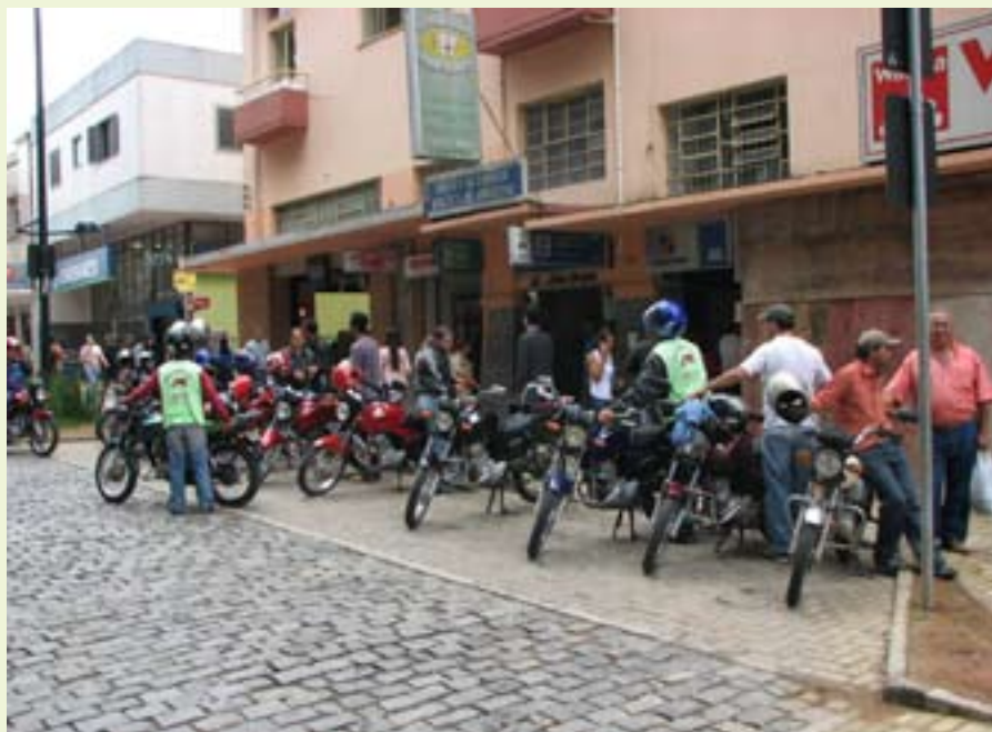
Os moto-taxistas estão providenciando a regularização de sua atividade

Dentro do processo de reformulação do sistema de transporte coletivo adotado pelo Governo Municipal, outra novidade é a regularização dos moto-táxis, uma outra opção de transporte para os usuários. O prefeito municipal regulamentou o serviço através do decreto nº 6.473, assinado em 31 de outubro.