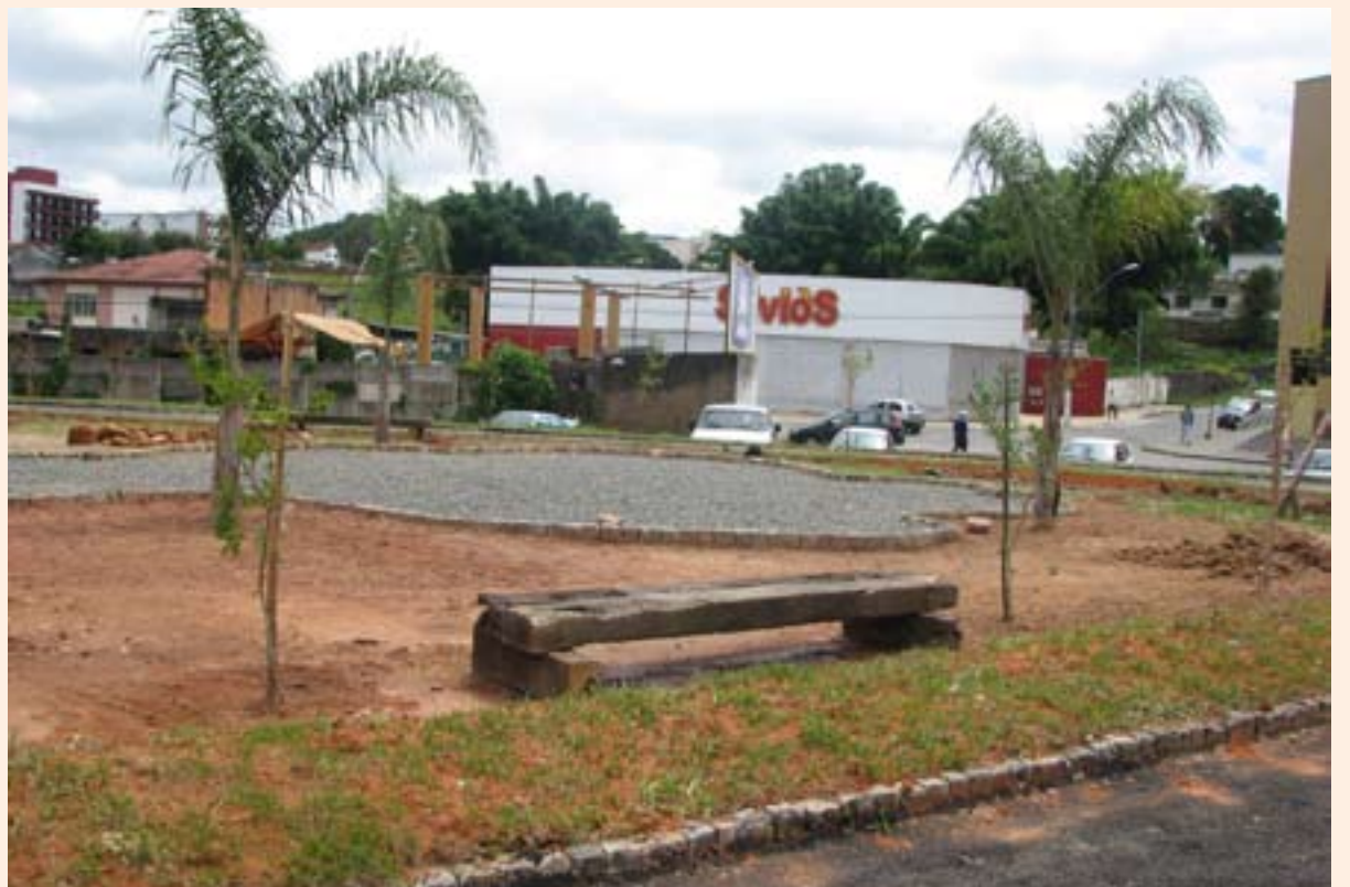
A praça Urias Barbosa de Castro recebeu bancos, grama e asfalto nos últimos dias

Outra obra que teve início na última semana foi a construção de uma nova escola no bairro Nova Cidade, que será feita com recursos da QESE. Com esta obra, o Governo Municipal cumpre o seu objetivo de ampliar o número de escolas da rede municipal. Em janeiro deste ano, o prefeito, através de decreto, conseguiu, junto ao governo do Estado, a municipalização de três escolas: Rotary, Lions e Doutor Martim Paolucci.