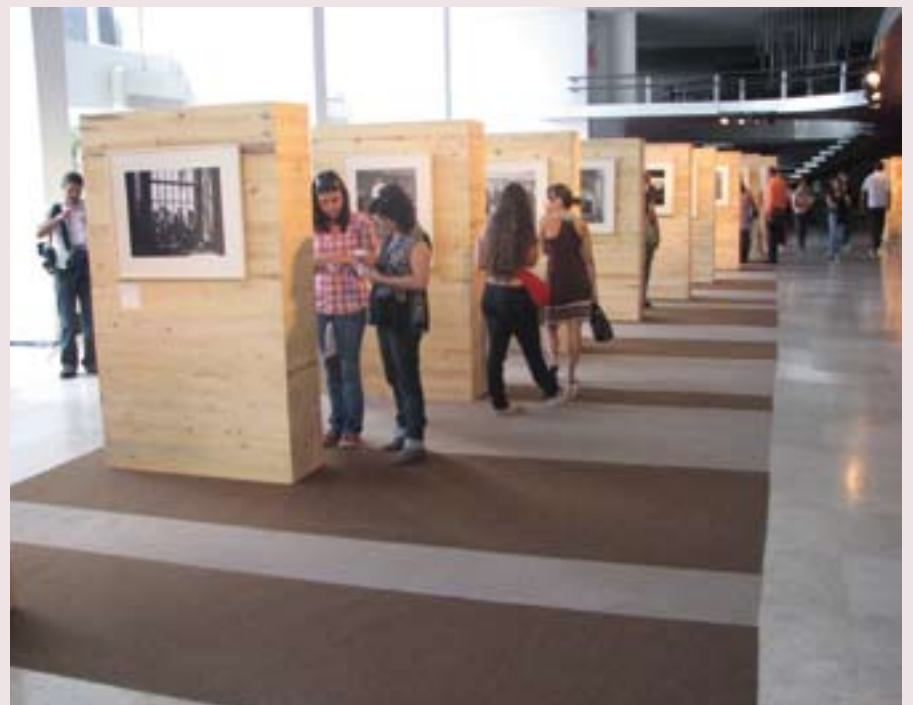
Algumas das fotografias publicadas em "Colônia - uma tragédia silenciosa" foram expostas durante a Jornada da Inclusão