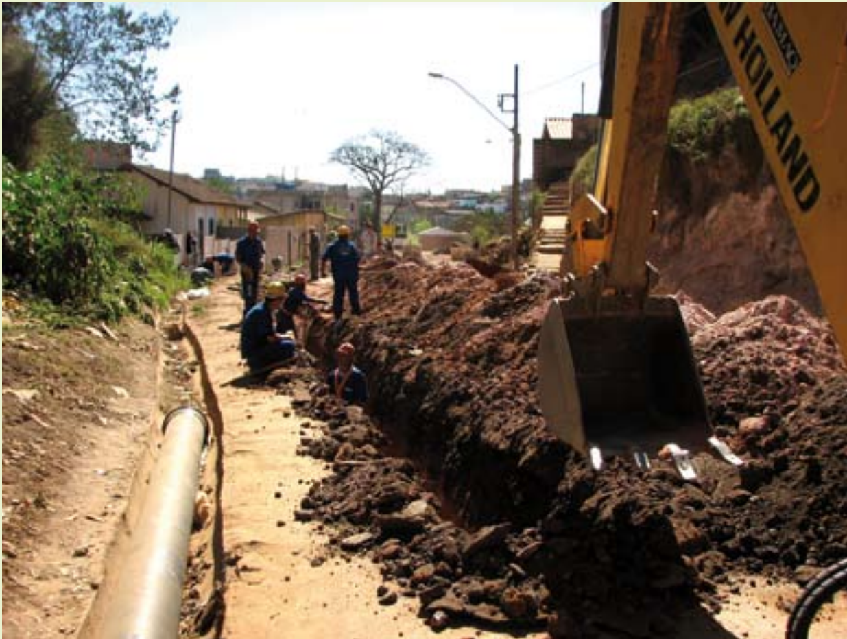
As obras de urbanização da avenida Eliezer Henriques, iniciadas esten ano, são financiadas pelo BDMG