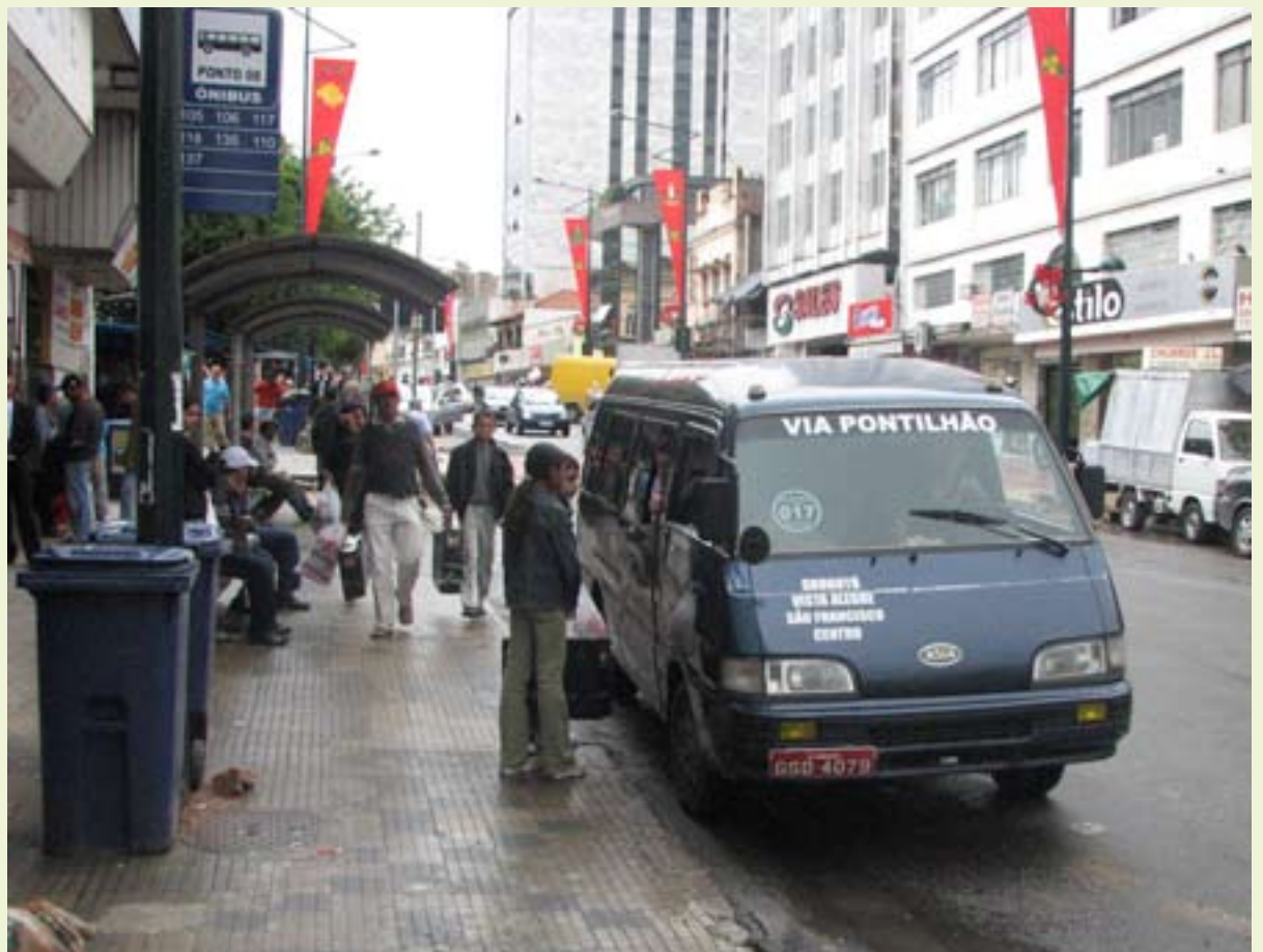
Devidamente identificadas e regulamentadas, as vans estão circulando há cerca de um mês