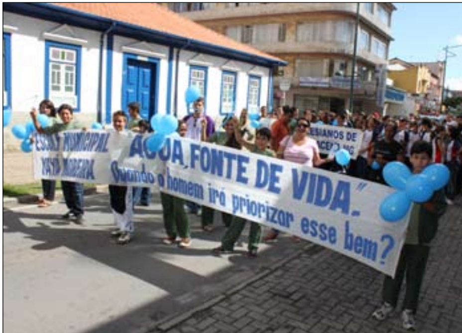
Oito escolas participaram na caminhada no centro da cidade