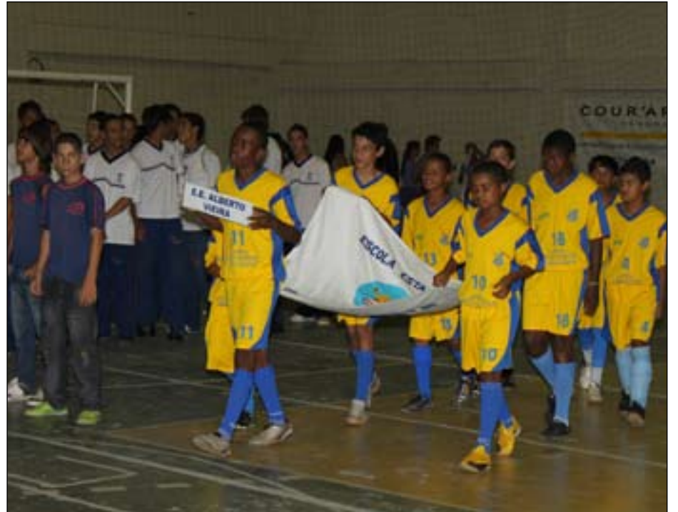
Cinco modalidades fazem parte desta primeira fase dos jogos

Mais de 300 estudantes estão envolvidos nos jogos nesta primeira etapa