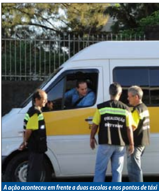
A ação aconteceu em frente a duas escolas e nos pontos de táxi

A Prefeitura Municipal, por meio da Diretoria Executiva de Trânsito e Transporte da Secretaria de Defesa Social promoveu no dia 11 de março, uma blitz educativa envolvendo os serviços de transporte escolar e de táxi. Essa primeira ação aconteceu em frente ao Colégio Imaculada Conceição e a Escola Estadual Amílcar Savassi, onde veículos de transporte escolar foram abordados para suas respectivas vistorias. Foram verificados o estado de conservação dos veículos e a documentação dos mesmos. A equipe da blitz percorreu ainda todos os pontos de táxi da cidade. Os motoristas rece-