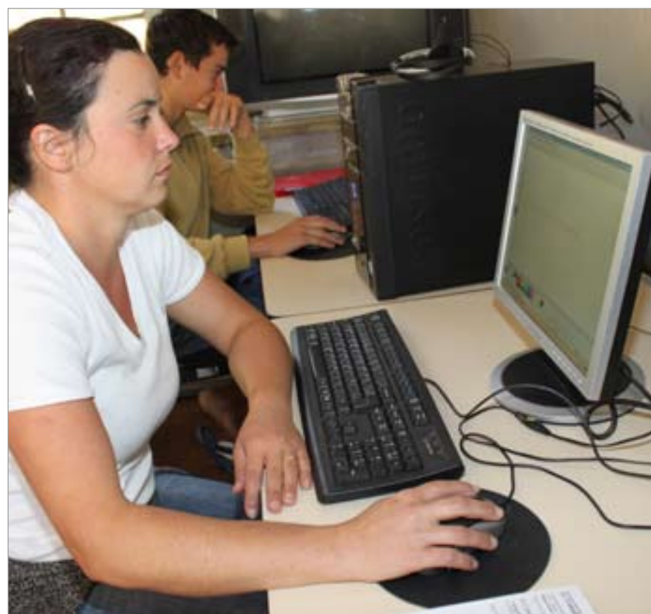
O curso será realizado durante seis sábados completando uma carga horária de 24 horas-aula

“O objetivo do curso é ensinar para alunos e moradores da comunidade do Campestre I o uso básico das novas tecnologias para inserção no mercado de trabalho. Hoje a turma inicial é composta por 10 alunos, porque o laboratório tem 11 computadores, com uso individual por pessoa