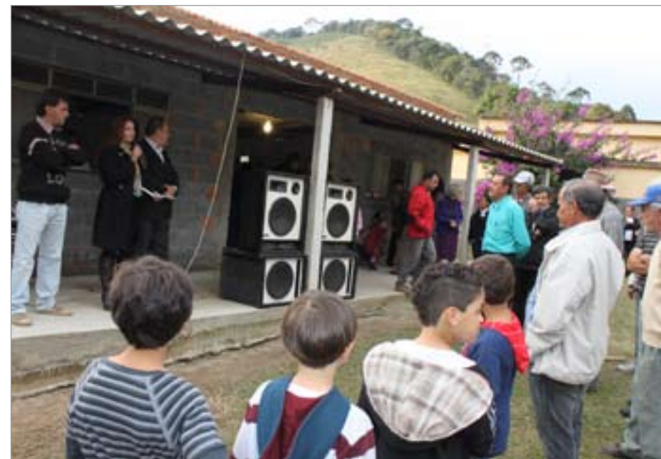
A prefeita Danuza Bias Fortes anunciou à comunidade o atendimento de uma das reivindicações dos moradores que é a iluminação pública

A prefeita Danuza Bias Fortes, acompanhada de assessores, participou da celebração eucarística e, na oportunidade, anunciou à comunidade o atendimento de uma das reivindicações dos moradores que é a iluminação pública. Segundo a prefeita, o custo das obras, que já foi quitado pela Prefeitura no último dia 26, é de R$ 44.705,90.