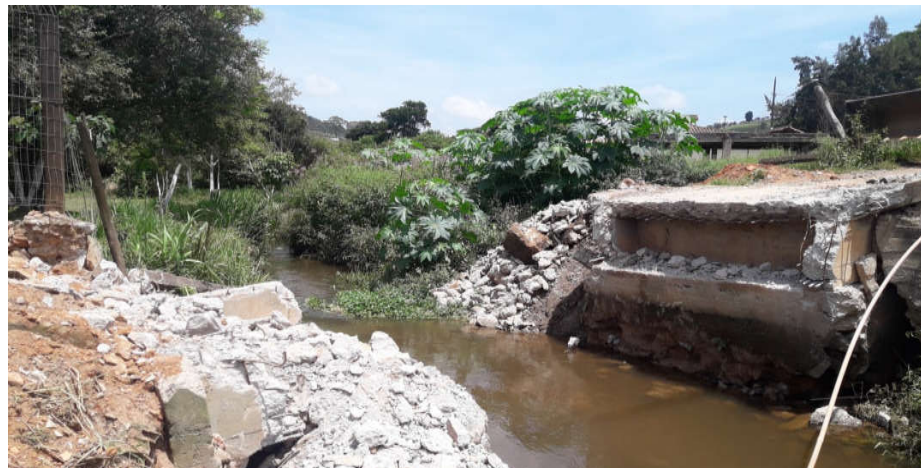
FOTO 03 Ponte existente demolida