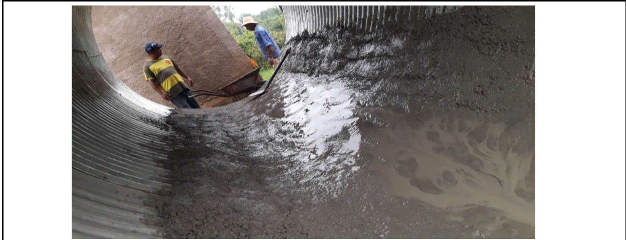
FOTO 04 Concretagem do tubulão conforme orientação da SETOP