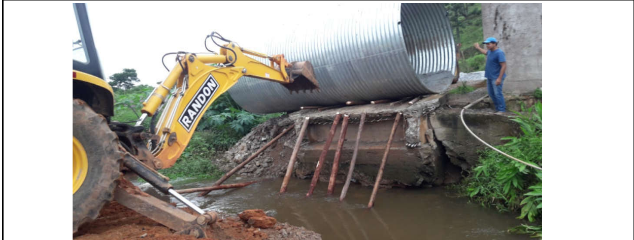
FOTO 05 Colocação do Bueiro Armco no canal