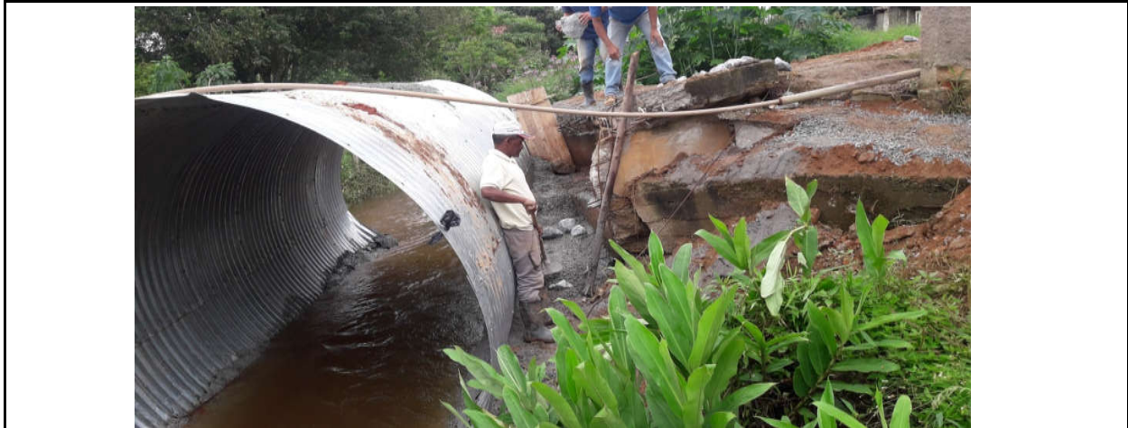
FOTO 06 Início do travamento do Bueiro Armco no local