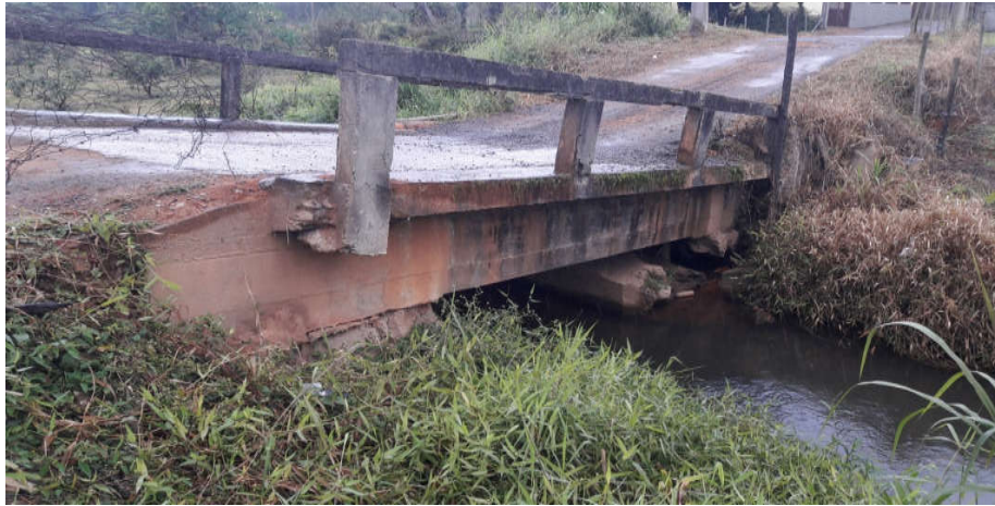
FOTO 01 Ponte danificada que existia no local