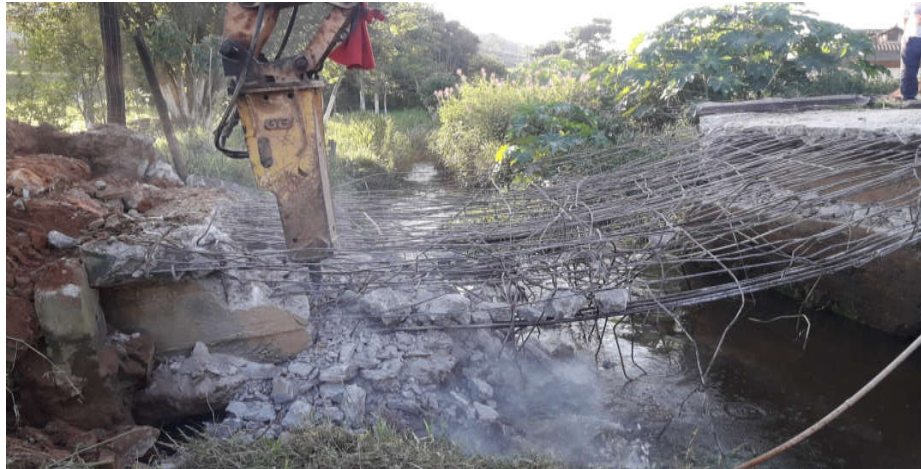
FOTO 02 Demolição da ponte danificada