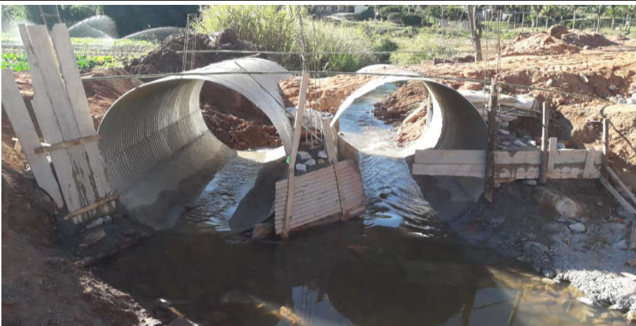
FOTO 06 Início do travamento do Bueiro Armco no local