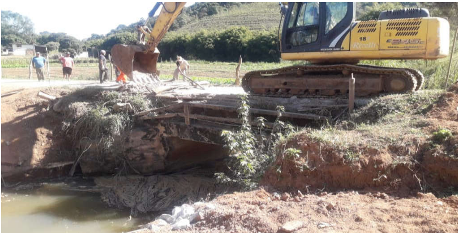
FOTO 02 Demolição da ponte danificada