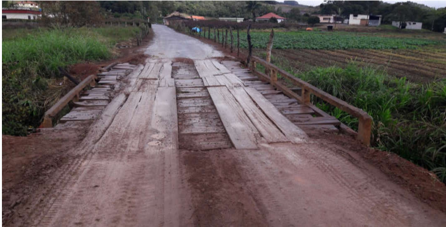
FOTO 01 Ponte danificada que existia no local