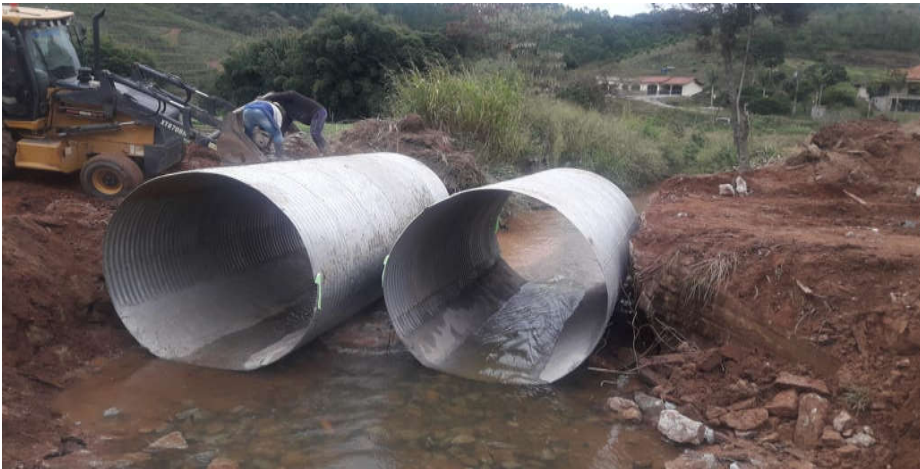
FOTO 05 Colocação dos Bueiro Armco no canal