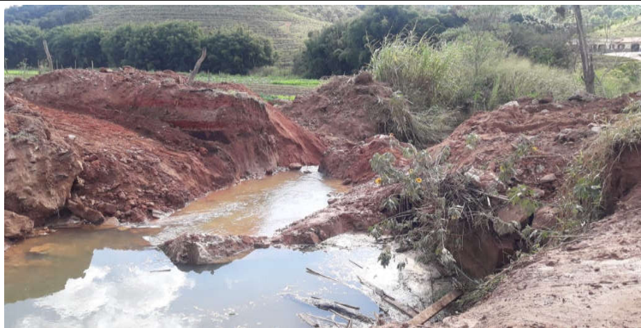
FOTO 03 Ponte existente demolida