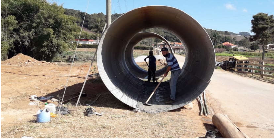
FOTO 04 Concretagem do tubulão conforme orientação da SETOP